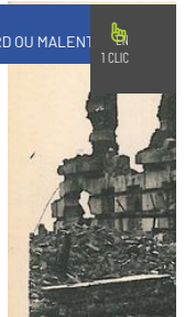
16 janvier 1920 : u