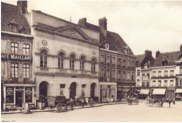
1918...Reconstruire un Hôtel de Ville

Parmi les éléments détruits, figure l'Hôtel de Ville qui doit être entièrement reconstruit. Un vaste débat se crée autour de son emplacement futur. Il animera les conseils municipaux et les discussions béthunoises pendant de nombreuses années. Découvrez les idées et propositions qui ont été faites et qui auraient pu changer le visage de Béthune après la Grande Guerre.