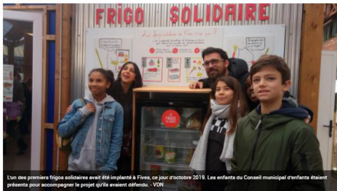
L'un des premiers frigos solidaires avait été implanté à Fives, ce jour d'octobre 2019. Les enfants du Conseil municipal d'enfants étaient présents pour accompagner le projet qu'ils avaient défendu.